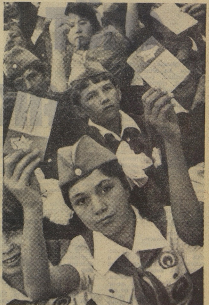
Мандат делегата съезда — это пионерский путёвка. Делегатов ждут с нетерпением в пионерских дружинах.